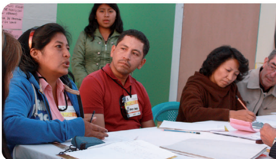
Fig. 5 En la MESA 3 de Plan de Turismo Sostenible los Actores de la Economía Popular Social y Solidaria debaten sobre las debilidades y fortalezas de la Zona en este eje

Estos dos ejes complementarios y que correrían por venas viales inteligentes se integran en dentro de una breve matriz o marco lógico levantado con el aporte de las Corporaciones INCLUIR y UTOPIA, favoreciendo su experiencia y organizando en una metodología que permita darle sostenibilidad y FORTALECIMIENTO DE LAS CAPACIDADES LOCALES para cumplir estos fines sociales que tiene fundamental identidad con dos aspectos: el primero la Conservación Ambiental en el Cerro Ilaló y sus territorios afines y el segundo la Inclusión de Género (femenino) como actores principales en el ejercicio de la Economía Popular Social y Solidaria. Cabe mencionar que con este proyecto y objetivos hemos presentado nuestra propuesta a la Convocatoria de la Unión Europea, para posible financiamiento.